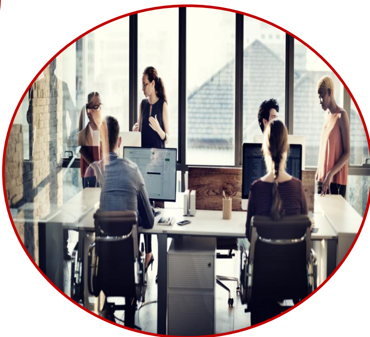
Benessere sui luoghi di lavoro