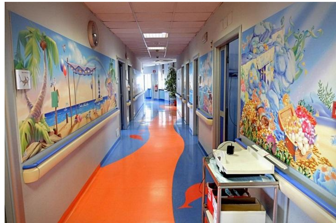
Umanizzazione della cura