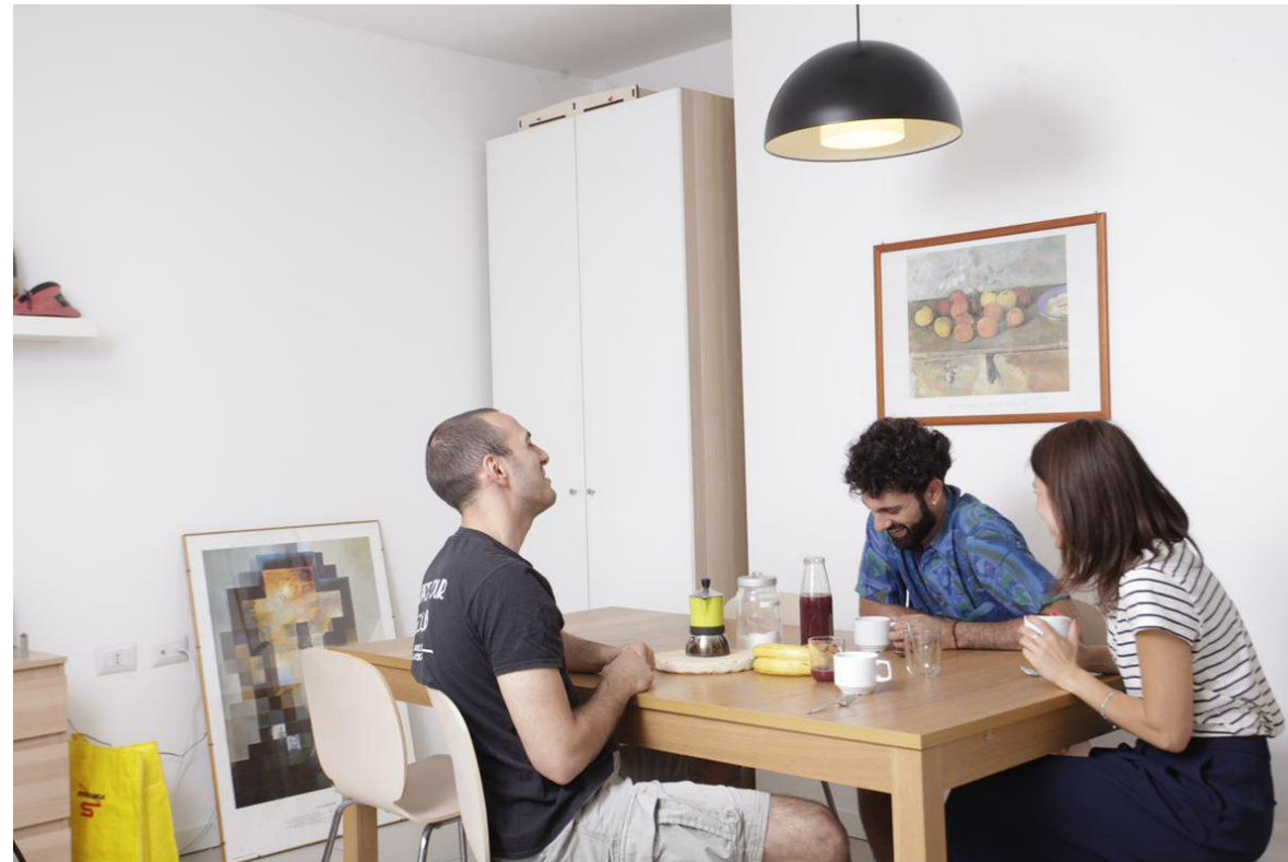
FOYER DI CENNI